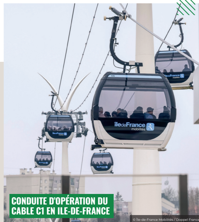
CONDUITE D'OPÉRATION DU CABLE C1 EN ÎLE-DE-FRANCE