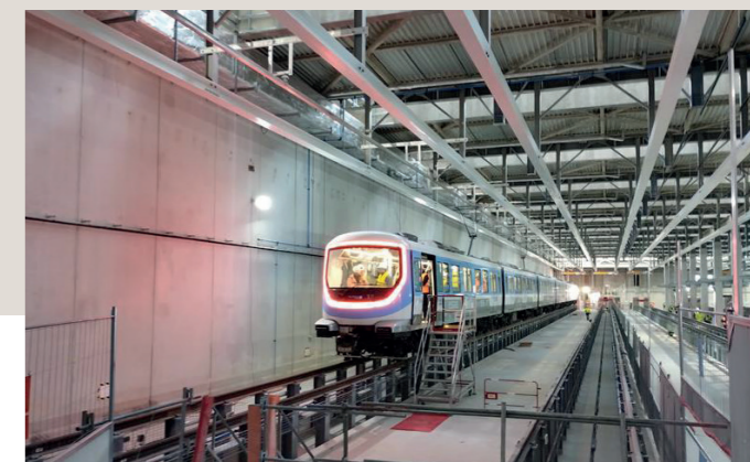
LIGNES 15, 16 ET 17 DU GRAND PARIS EXPRESS

Maîtrise d'œuvre de l'aménagement des pistes cyclables sur l'ensemble du territoire de Paris dans le cadre du plan Vélo 2021-2026.