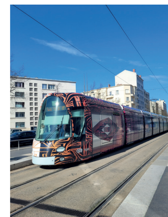
TRAMWAY T1 ET T2 A LYON

Pilotage et dimensionnement électrique des ateliers et dépôts, élaboration du programme fonctionnel et technique.