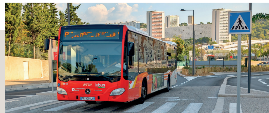
BHNS B3/B4 MARSEILLE

setec , une ingénierie à vos côtés pour des solutions innovantes et durables au service des usagers.