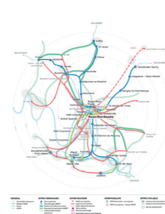
SERM DE ROUEN

Maîtrise d'œuvre, coordination et déploiement des systèmes courants forts et faibles, équipements électromécaniques, voie ferrée et façades de quai.