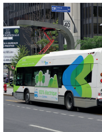
SYSTÈME DE CHARGE DES BUS ÉLECTRIQUES À MONTRÉAL

Assistance à maîtrise d'ouvrage pour la définition de l'offre de services, la conception des systèmes, le pilotage et le déploiement du programme.