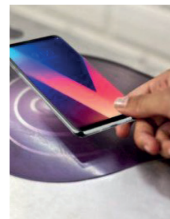
BILLETTIQUE EN ÎLE-DE-FRANCE

Assistance pour la préfiguration du SERM de Rouen : élaboration du schéma d'ensemble, de la chronique de déploiement des services, rédaction du dossier de statut.